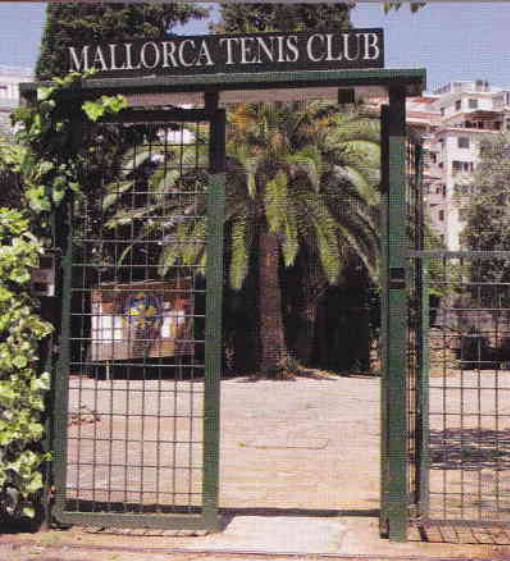
Mallorca Tennis Club.