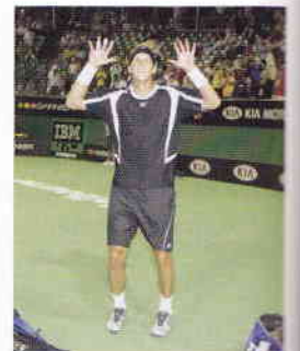
Pim-Pim dansade ibland för fansen efter segrarna.