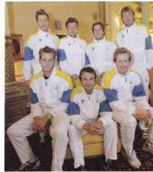
Pim-Pim drog på sig landslagsdressen med jämna mellanrum.

– Det finns bara ett svar på den frågan: det är t-i-m-i-n-g, understryker Pim-Pim på sitt självklara sätt.