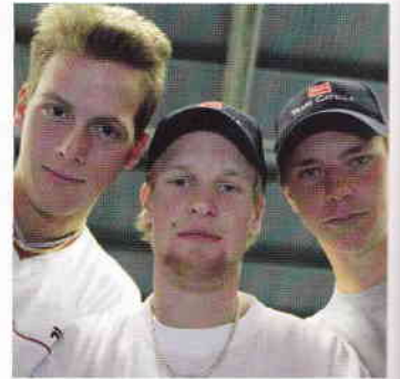
Tillsammans med Robin Söderling och Jonas Fröberg ingick Pim-Pim i Team Cafarella.